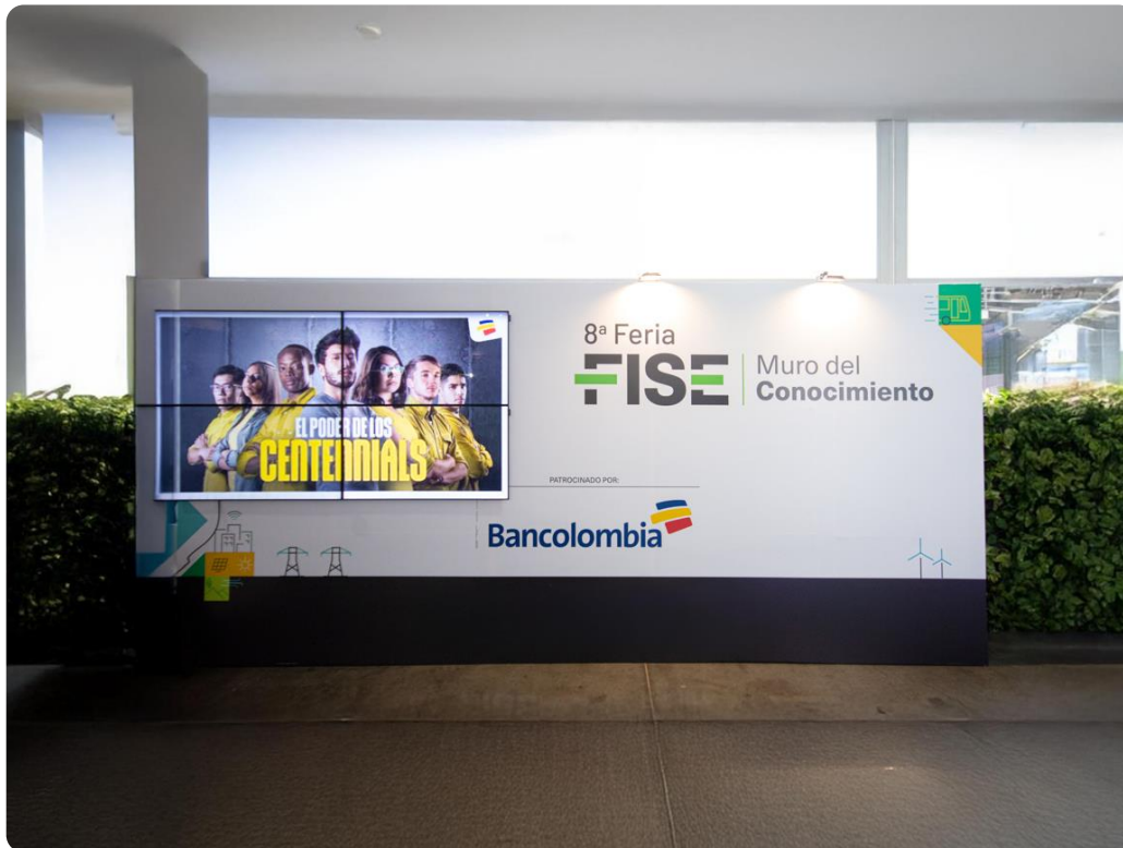
Imagen de referencia Las medidas pueden variar.